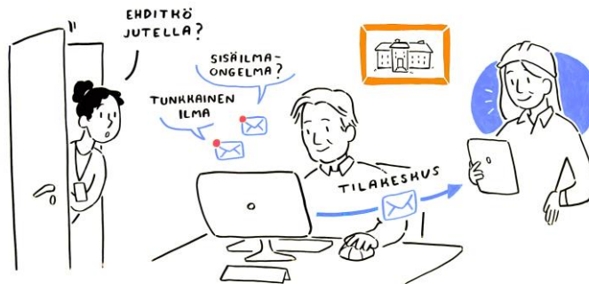
Kuva 2. Esihenkilöllä tulee aina olla aikaa aidosti kohdata työntekijä, joka ilmoittaa sisäympäristöön liitetyistä haitista. Ilmoitus sisäympäristöön liitetyistä haitista tulee aina tehdä myös kirjallisesti. (Piirroskuva: Tussitaikurit Oy)

Vika- ja häiriilmoitukset tehdään usein sähköisellä järjestelmällä kiinteistönomistajan edustajalle, esimerkiksi kiinteistöpalvelulle. Vuokrakohteissa ilmoitus menee sekä hyvinvointialueelle että kunnalle. Tärkeää on, että ilmoitus tehdään aina kirjallisesti ja että se tallentuu myös kohteen seurantaan ja toimenpiteitä varten.