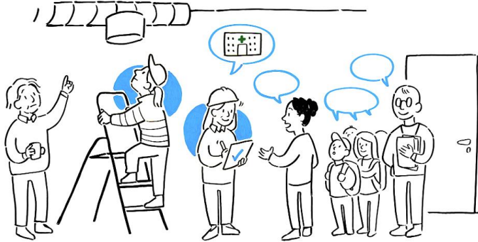
Kuva 3. Tilanteen selvittämiseen on hyvä tarttua ripeästi ja jalkautua kohteeseen. Käyttäjät voivat auttaa kohdentamaan haittaa, mutta oireilu ei ole suora merkki rakennuksen kunnosta. (Piirroskuva: Tussitaikurit Oy)

Ensivaiheessa nopea jalkautuminen kohteeseen ja käyttäjien kuuleminen, tilanteen havainnointi ja ilmeisten vikojen tunnistaminen on havaittu hyväksi toimintatavaksi. Hyvinvointialueen edustajan on hyvä olla mukana, kun kohteeseen mennään. Tekniset viat ja vauriot, kuten lämpötila- ja ilmanvaihto-ongelmat tai akuutti vesivuoto, ja muut vastaavat kiinteistöhoitoon liittyvät asiat, hoidetaan kiinteistöhuollon toimin. Koettujen haittojen, kuten epämääräisen hajuhaitan, selvittämisessä tarvitaan jo ensivaiheessa yleensä erityisasiantuntemusta. Onkin tarpeellista koota ryhmä, joka tukee kiinteistöhuollon toimintaa mm. sisäilma-asioiden, talotekniikan, rakennustekniikan tai -automaation saralla. Usein tilanteet ratkeavat jo ensivaiheen selvityksessä ja kiinteistöhuollollisilla toimilla. Ensivaiheessa tehtyjen havaintojen ja mahdollisten toimenpiteiden osalta tehdään yhteenveto sekä tarvittaessa suunnitelma seurannasta ja jatko-toimenpiteistä. Ensivaiheen yhteenvedosta viestitään asianomaisille.