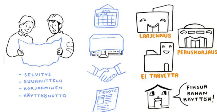
Kuva 6. Sisäilmatilanteesta tehtyjen arvioiden ja jatkotoimien tulee perustua tehtyihin selvityksiin. Toimien tulee olla oikein mitoitettuja. (Piirroskuva: Tussitaikurit Oy)

Toimenpiteiden on perustuttava selvitysten pohjalta tehtyyn tilannearvioon ja suunniteltuihin tavoitteisiin sekä tilan aiottuun jatkokäyttöön. Toimenpiteitä voivat olla mm. haitan poistaminen hyvän rakennustavan mukaisesti tai esimerkiksi korjauksia odottaessa käyttöä turvaavat toimenpiteet eli olosuhteiden parantaminen väliaikaisratkaisuilla tasolle, jossa rakennuksen sisäolosuhteet eivät aiheuta haittaa. Yleensä käytetään useita ratkaisuja samanaikaisesti, kuten rakenteiden tiivistämistä, ilmanvaihdon säätämistä ja ilmanvaihdon parantamista. Käyttöä turvaavien toimenpiteiden tulee olla perusteltuja, suunniteltuja ja niiden elinkaari tulee määritellä. Lisäksi toimenpiteiden toimivuutta tulee seurata säännöllisesti ja suunnitella, miten toimitaan, jos tehdyistä toimenpiteistä huolimatta haittoja edelleen esiintyy. Toimenpiteiden aikana tulee varmistua työmaaolosuhteiden hallinnasta (mm. puhtauden- ja pölynhallinta) sekä laadunvarmistuksesta ja dokumentoinnista. Toimenpiteiden ajaksi voidaan tarvita mahdolliset väistötilat. Mikäli työ jatkuu rakennuksessa toimenpiteiden ajan, on työnantajan, hyvinvointialueen, oltava tietoinen kaikista rakennuksessa tapahtuvista toimenpiteistä ja varmistaa, että turvallinen työympäristö ei vaarannu.