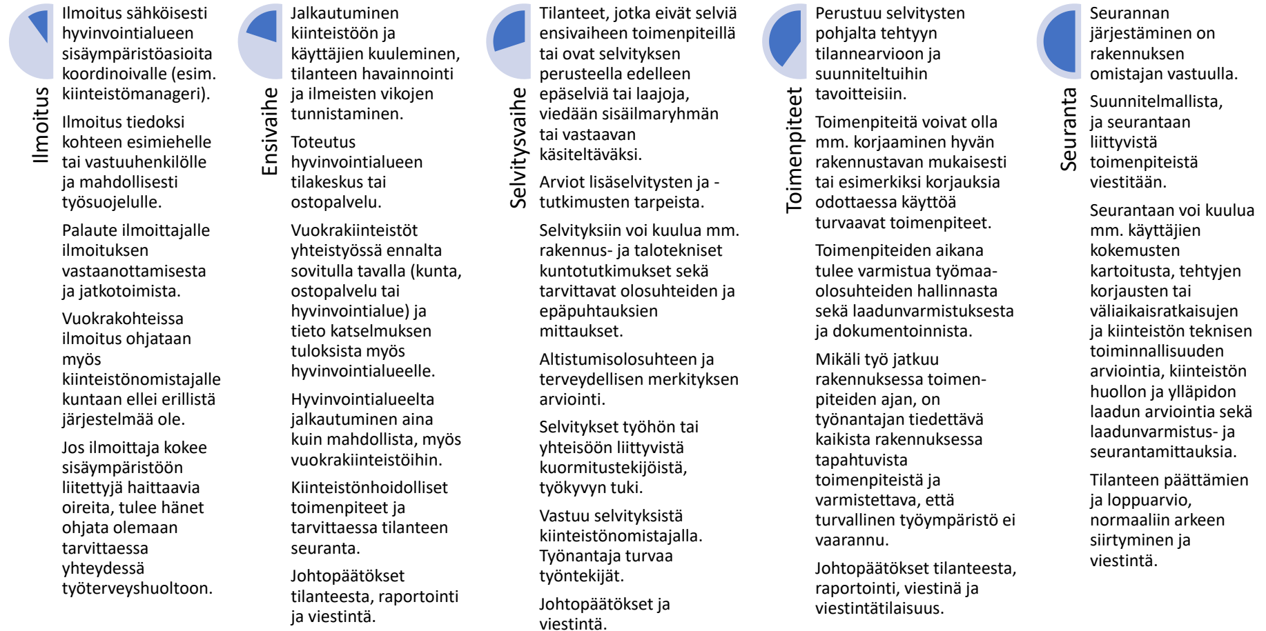
Kuva 1. Hyvinvointialueita koskeva Terveet tilat -toimintamalli.