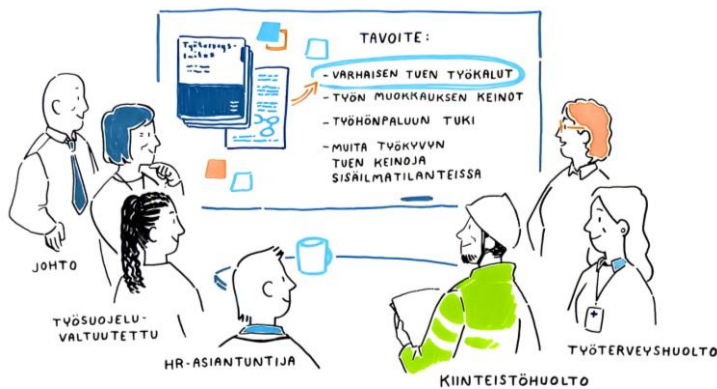
Kuva 5. Työkyvyn tuen toimintamalli on hyvä ottaa osaksi prosessia työyhteisöön liittyvissä kuormitustilanteissa (Piiroskuva: Tussitaikurit Oy ja Työterveyslaitos 2023).

Tällaisia haittatekijöitä voivat olla esimerkiksi työhön tai yhteisöön liittyvät kuormitustekijät. Sisäilmatilanteissa tilojen käyttäjien työkykyä ja työssä jatkamista on tuettava ja työkyvyn heikkenemistä ehkäistävä riippumatta siitä, johtuuko se työtiloihin liittyvistä tekijöistä tai ei. Työkykyä voidaan tukea esimerkiksi Työterveyslaitoksen Työkyvyn tuki sisäilmatilanteissa –toimintamallilla ( https://www.ttl.fi/teemat/tyohyvinvointi-ja-tyokyky/sisailma/tyokyvyn-tuki-sisailmatilanteissa ).